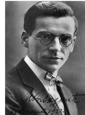
IVO ANDRIĆ (1892–1975)

„[...] na belom konju sa pozlaćenim uzdama i crvenim kičankama, u tamnomodroj, zlatnom vezenoj uniformi, vitak i kao saliven, serasker Omer-paša. Ličio je pomalo na priviđenje, i to začudo blago i dobrosrećno. Kao da ne jaše na konju, nego plovi na oblaku. Iznenađena i zadivljena svetina videla je, ne verujući svojim rođenim očima, kako mu odsjaj svetlosti predvečernjeg sunca pada na grudi i osvetljava lice sa lako prosedom bradom i izrazom strogog dostojanstva i zagonetke blagosti.” (OMERPAŠA LATAS)