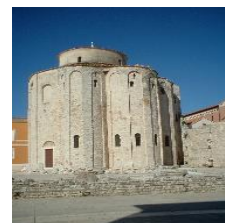
ZADAR – BISERICA SF. DONAT