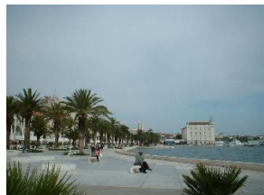
SPLIT – RIVA