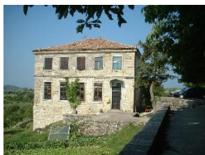
HUM – CEL MAI MIC ORAȘ DIN LUME