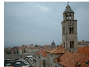
DUBROVNIK – ZIDURILE