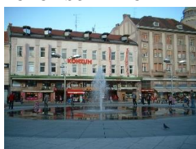
OSIJEK – PIAȚA ANTE STARČEVIĆ