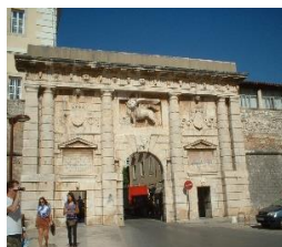
ZADAR – POARTĂ A ORAȘULUI (KOPNENA VRATA)