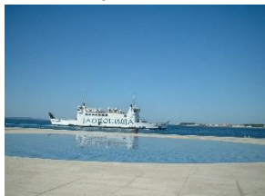
ZADAR – INSTALAȚIA SALUTUL SOARELUI